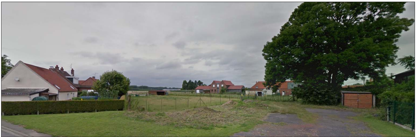
Vue sur le terrain visé par l'Orientation d'Aménagement et de Programmation